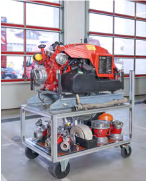
Rollwagen - Tragkraftspritze