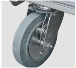
Hochwertige Rollen/ Lenkrollen