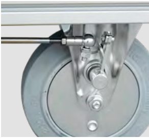
Laufradbremse aus verzinktem Stahl