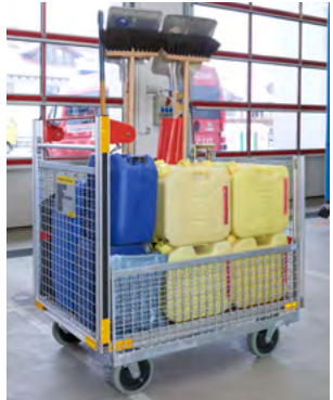
Rollwagen - Gefahrgut