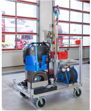
Rollwagen - Reinigung