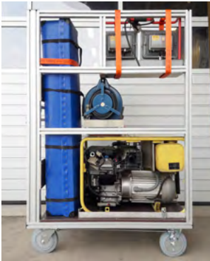
Rollwagen - Strom/ Licht